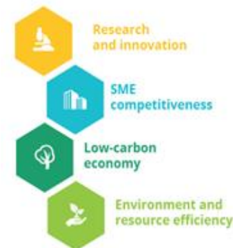
2021-2027 1 cross-cutting priority on capacity building